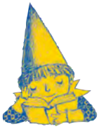
La bobada celeste

la llamaba su marido (corderita), y las colecciona por decenas. Tampoco confiaba en Charlie, pero se ablandará cuando este le regale un peluche en forma de oveja. Siempre tiene en casa dulces navideños (polvorones, mantecados...) que come en cualquier época del año, incluso en pleno agosto.