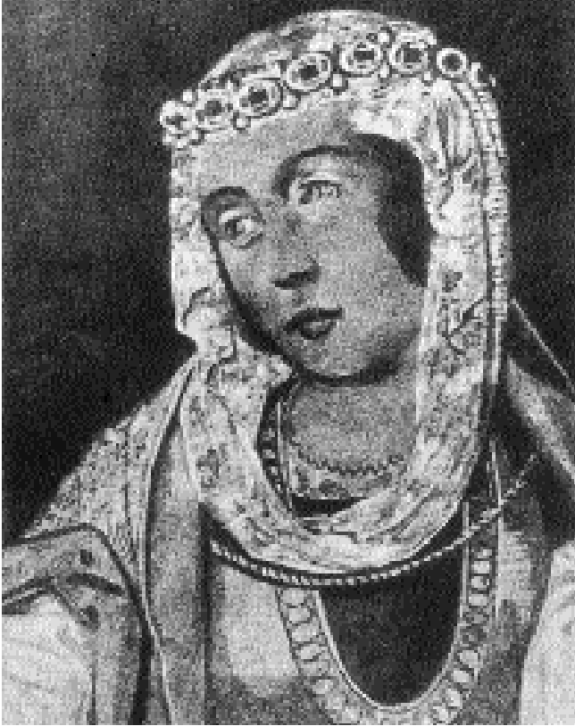
Juana de Castilla (1462-1530). Los rumores cortesianos difundieron que no era hija del Rey sino de don Beltrán de la Cueva, por lo que fue apodada la Beltraneja.

dobeses en aparecer sobre el escenario son Laurencia y Pascuala, que en seguida plantean el asunto principal y el problema que afecta a la primera de ellas.