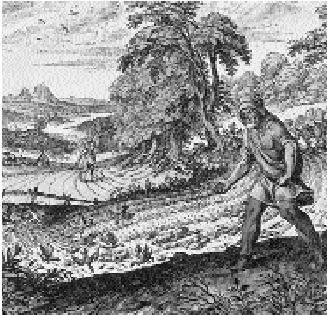
Lope de Vega dignifica en su teatro la figura del villano a través del personaje del labrador rico y honrado, que debe su riqueza a su propio esfuerzo. La siembra, grabado del siglo XVII.

□ ¿En qué verso se alude al lugar en que sucede esta escena?