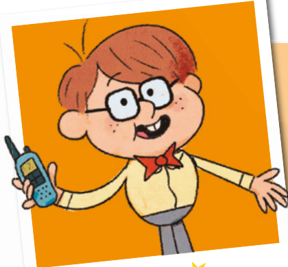
★ Doc ★

Doc Watson es el mejor amigo de Sherlock. Está siempre en contacto con él gracias a sus superwalkie-talkies .