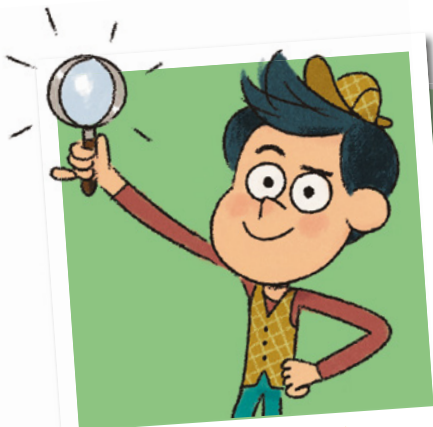
★ Sherlock ★

Sherlock tiene siete años y vive rodeado de enigmas. Su padre, el gran Sherlock Holmes, le ha enseñado a descifrarlos desde su más tierna infancia. Como buen detective, nunca sale de casa sin su lupa.