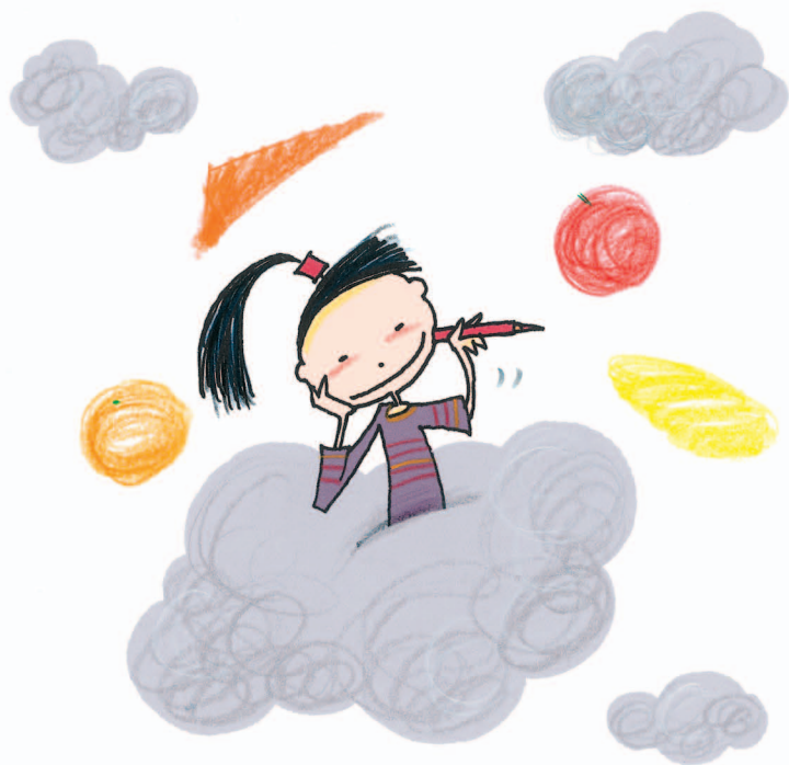
Ilustración: Andrés Guerrero