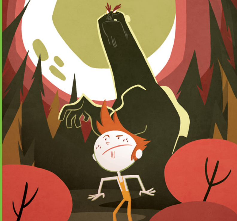
Ilustración: Fran Collado